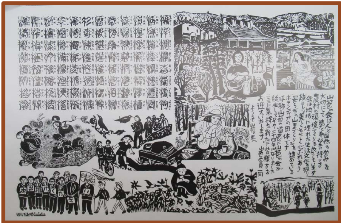
2018年のポスター 山苞の会 倉富敏之様 作