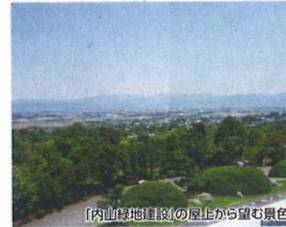
「内山緑地建設」の屋上から望む景色

田主丸の秋の特産市である「耳納の市」と、旬な柿と巨峰ワインが味わえる「柿祭り&ヌーボー祭り」が同日開催され、参加できるコースです。是非、この機会に晩秋の田主丸を満喫してください。