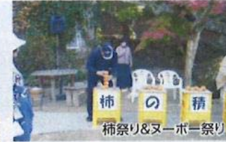
柿祭り&ヌーボー祭り