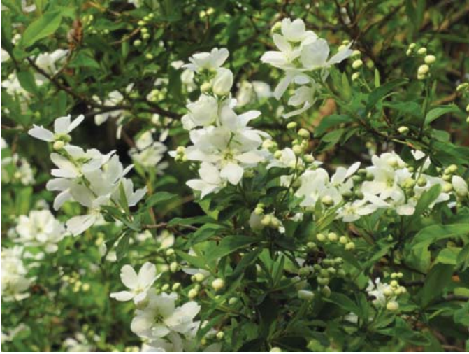
リキュウバイ(利休梅)