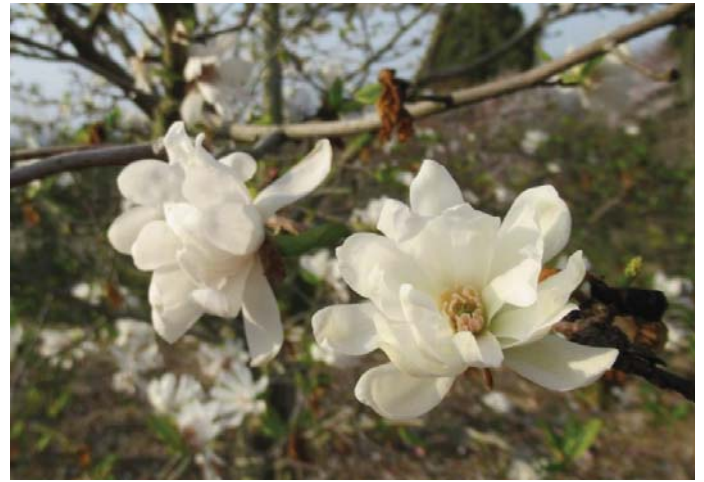
ヒメコブシ(姫辛夷)