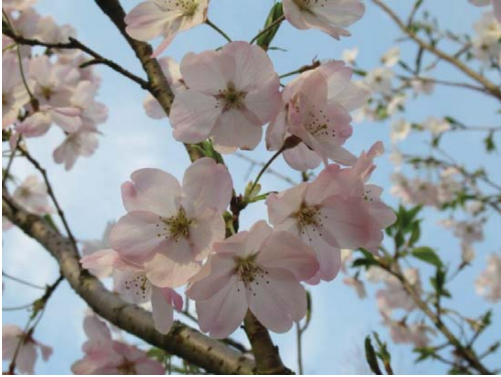
ジンダイアケボノ(神代曙)