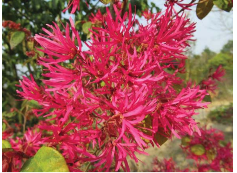
ベニバナトキワマンサク (紅花常盤万作)