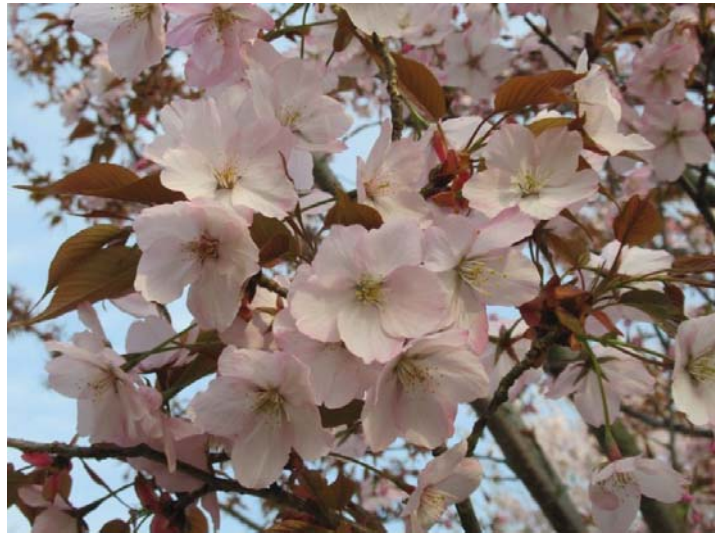
センダイヤ(仙台屋)