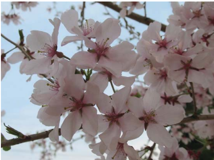
コシノヒガン(越の彼岸)