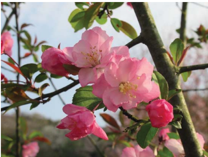
ハナカイドウ(花海棠)