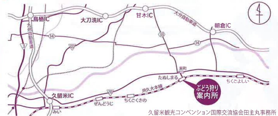
久留米観光コンベンション国際交流協会田主丸事務所 「ぶどう狩り案内所」は、JRためしまる駅(かっぱ駅)の中にあります。