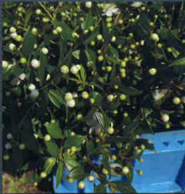
アロマの植木販売

この他にも出店・出演多数！ くわしくは福岡県緑化センターホームページでご確認ください