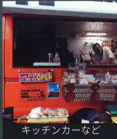
キッチンカーなど