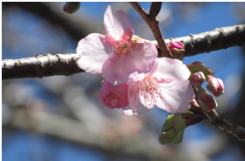
カワツザクラ(河津桜)