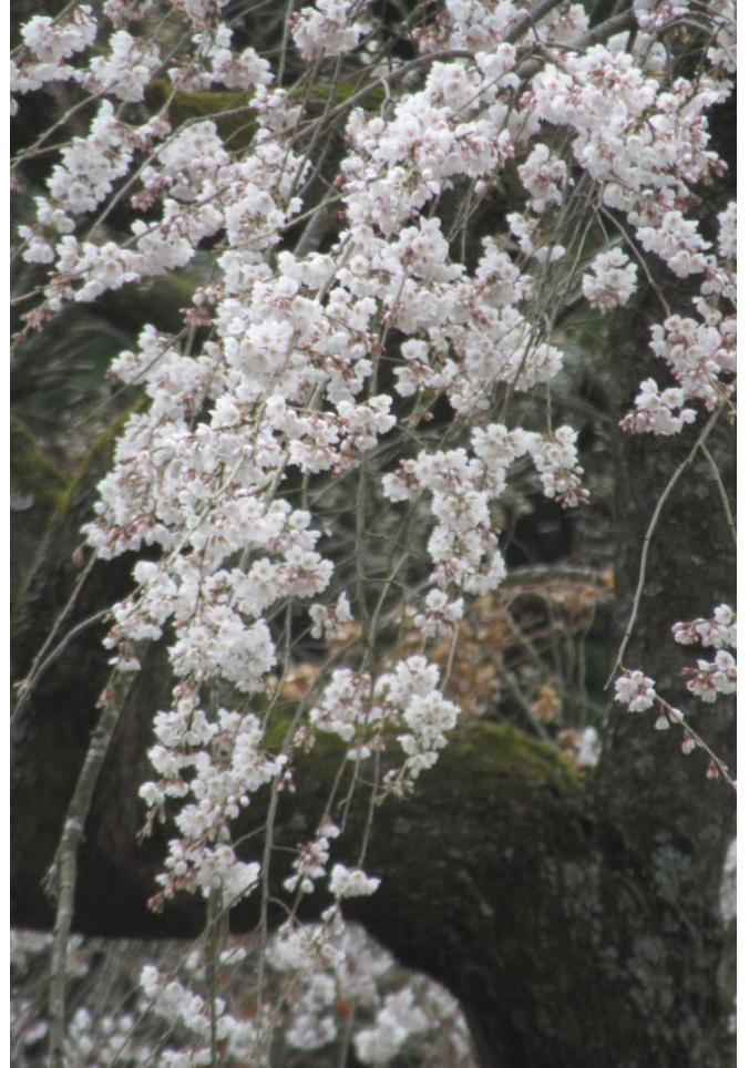
オオカンザクラ(大寒桜)