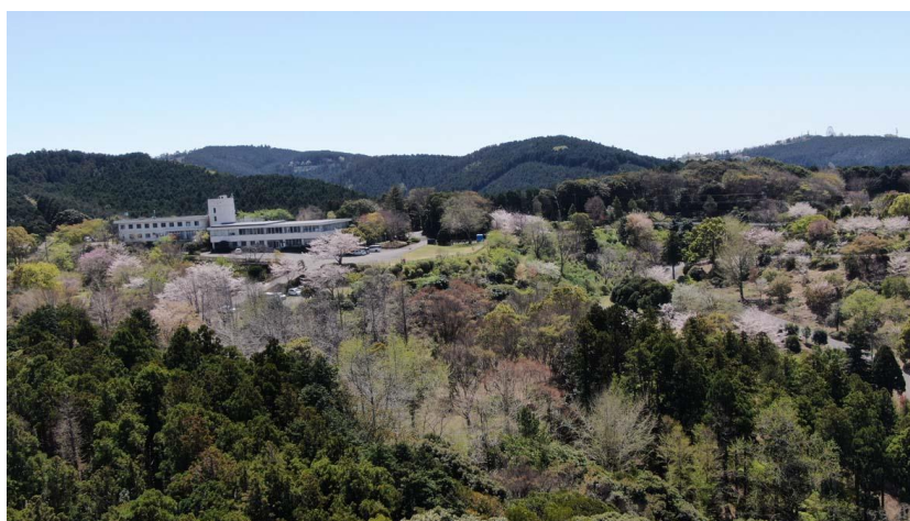
写真:君津グリーンセンター(旧樹芸林業試験場)

千葉県君津市に位置する樹林に囲まれた造園樹木生産のための圃場、及び自然散策路です。グリーンセンターそれ自体が里山林の性格を持ち、コナラ・クヌギ等カブトムシ・クワガタムシ等の昆虫の集まる木、千葉県 RL 要保護生物(C)のモリアオガエル等の棲息している池等、二次的自然環境を維持している豊かな生態系の山林です。又、東京湾、富士山を眺望する展望台、養蜂のためのスペースと共に、開園日には君津市内の小学校、幼稚園を始め、行政、NPO・各種団体等の自然散策コース、生態系を学ぶ場として利用されています。